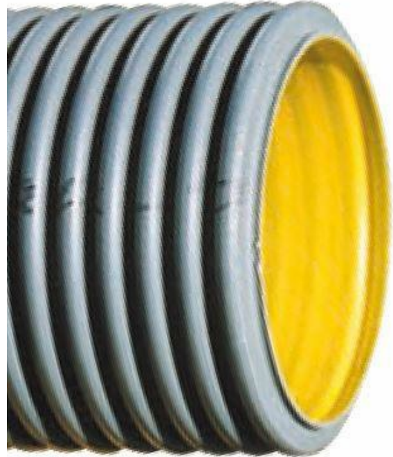
L'image est à titre indicatif seulement

Le fabricant applique un code de déontologie et un modèle d'organisation, de gestion et de contrôle conformément au décret législatif 231/01 et peut fournir des informations sur ses impacts économiques, environnementaux et sociaux (ESG), comme indiqué dans un rapport de durabilité conforme aux normes GRI 2021 et certifié par un tiers accrédité.