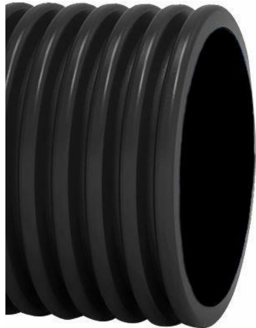
L'image est à titre indicatif seulement

Le fabricant applique un code de déontologie et un modèle d'organisation, de gestion et de contrôle conformément au décret législatif 231/01 et peut fournir des informations sur ses impacts économiques, environnementaux et sociaux (ESG), comme indiqué dans un rapport de durabilité conforme aux normes GRI 2021 et certifié par un tiers accrédité.