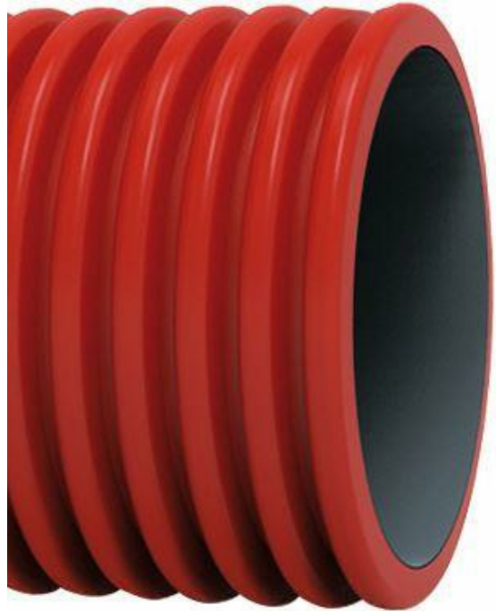
L'image est à titre indicatif seulement

Le fabricant applique un code de déontologie et un modèle d'organisation, de gestion et de contrôle conformément au décret législatif 231/01 et peut fournir des informations sur ses impacts économiques, environnementaux et sociaux(ESG), comme indiqué dans un rapport de durabilité conforme aux normes GRI 2021 et certifié par un tiers accrédité.