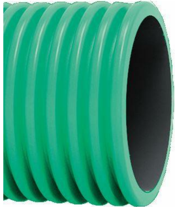
L'image est à titre indicatif seulement

Le fabricant applique un code de déontologie et un modèle d'organisation, de gestion et de contrôle conformément au décret législatif 231/01 et peut fournir des informations sur ses impacts économiques, environnementaux et sociaux(ESG), comme indiqué dans un rapport de durabilité conforme aux normes GRI 2021 et certifié par un tiers accrédité.