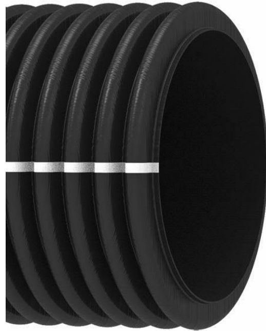
L'immagine ha il solo scopo illustrativo

Il produttore applica codice etico e modello di organizzazione gestione e controllo ai sensi del D. Lgs. 231/01 e può fornire informazioni relative ai propri impatti economici, ambientali e sociali (ESG) rendicontati da un Bilancio di Sostenibilità conforme ai GRI Standards 2021 certificato da ente terzo accreditato.